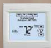
THERMOSTAT INTELLIGENT VISIONPRO® 8000