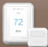
THERMOSTAT INTELLIGENT T10 PRO